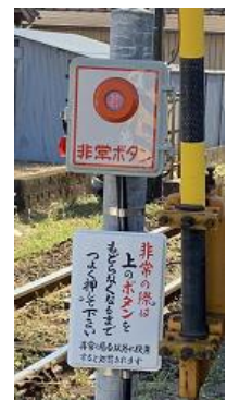
押ボタン式踏切 支障報知装置

④一部の踏切道には、押ボタン式踏切支障報知装置が設置してあります。踏切道内において車が立往生している等、異常があった場合または発見した時は非常ボタンを強く押してください。異常を列車に知らせるシステムになっています。