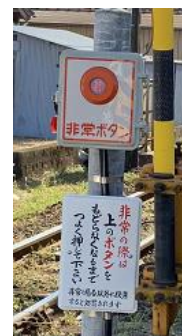
押ボタン式踏切支障報知装置